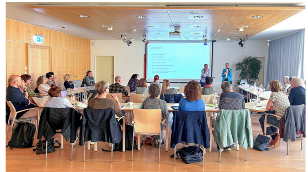
Kursgruppe Runder Tisch