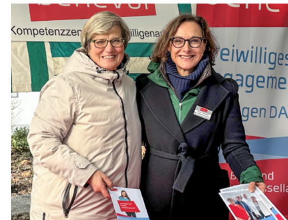
Standpräsenz am Herbstmarkt in Sissach.