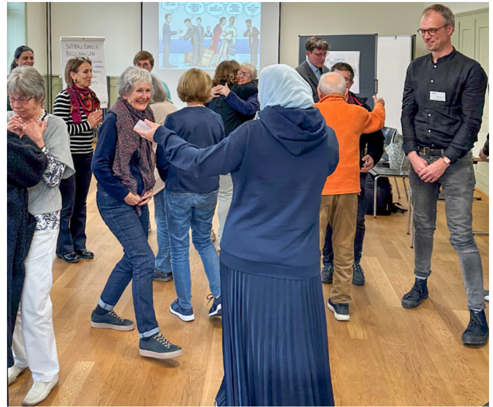
Workshop zum Thema «Interkulturelle Kompetenz»