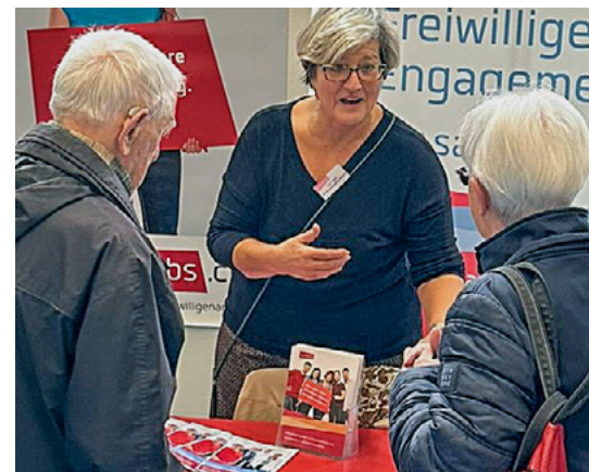
Standpräsenz an der Seniorenmesse in Reinach